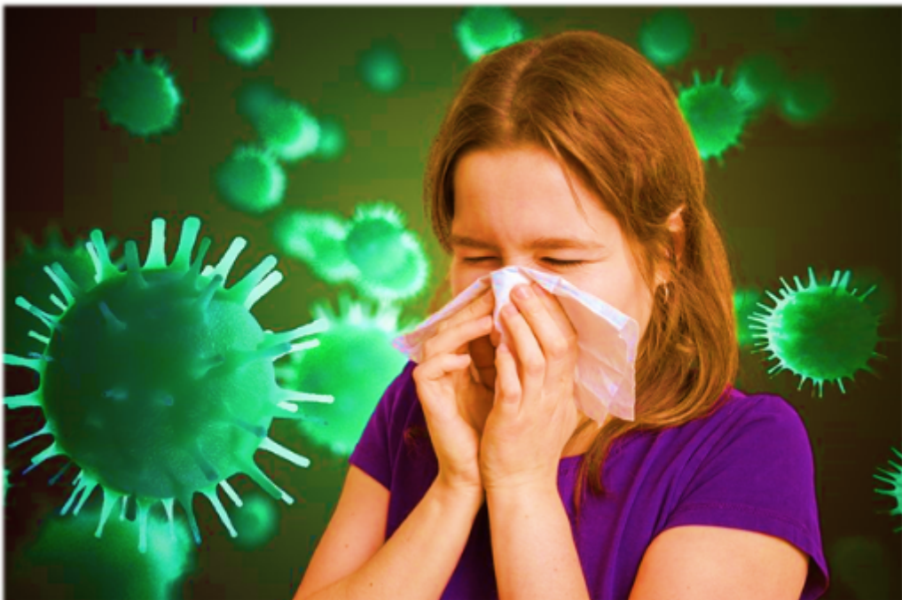
Как не заразиться